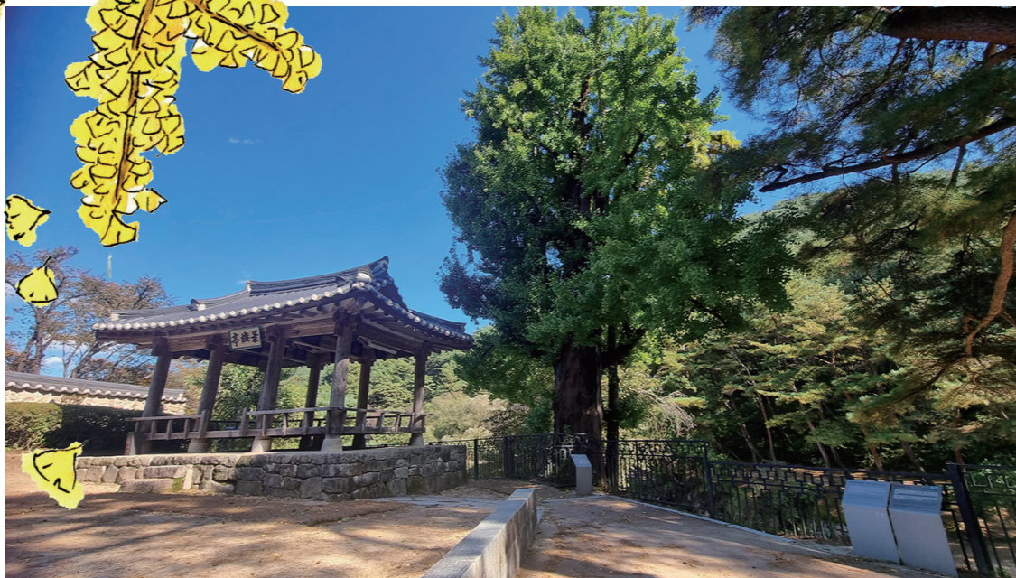
〈죽계천 500년 은행나무〉

수백여 년의 세월을 머금은 학자수처럼 500여 년의 수령을 지닌 두 그루의 은행나무도 사람들의 눈길을 끈다. 한 그루는 경림정을 옆에 두고 죽계천을 바라보듯 섰고, 또 다른 은행나무는 경림정 앞쪽의 나지막한 언덕 소훈대 한쪽에 서 있다.