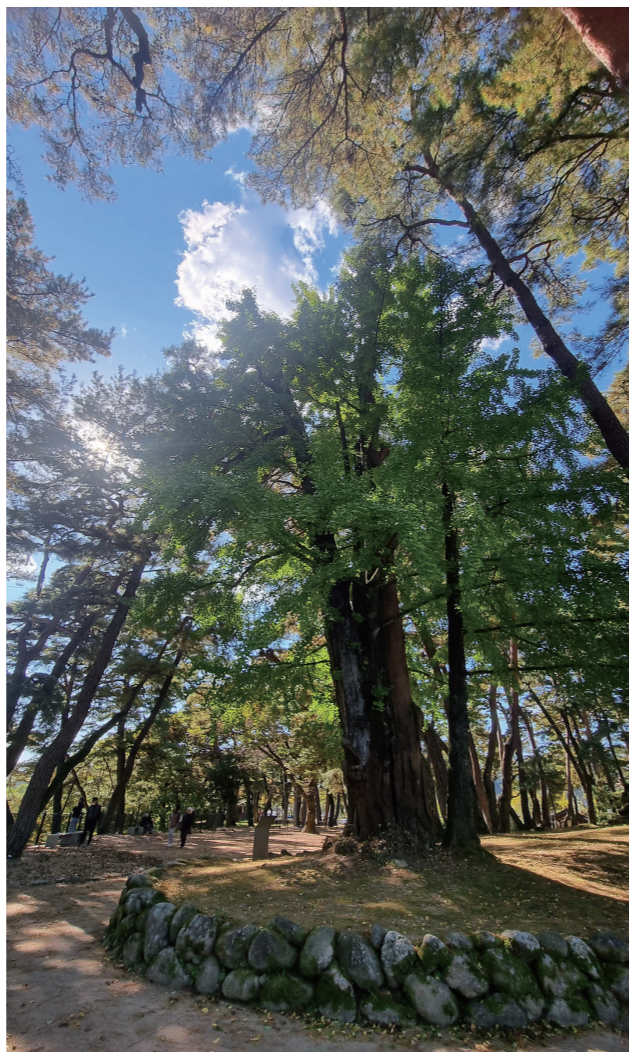
〈소훈대 500년 은행나무〉

수피가 벗겨지고 전란은 물론, 여름날의 비바람과 뜨거운 햇볕, 혹한을 견디고 500년을 깨끗하게 살면서 거목이 된 은행나무이다. 소수서원을 찾는 사람들은 하늘을 찌를 듯한 이 은행나무를 고개를 뒤로 젖혀 올려다보지 않을 수가 없다. 하늘에 닿을 듯한 은행나무를 보면 저절로 감탄하게 되고, 곤고한 환경에서 거대하게 성장한 자태에 압도당할 듯 숙연해지고 만다.